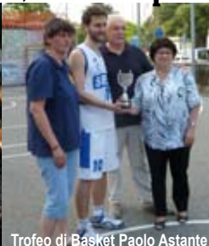
Trofeo di Basket Paolo Astante

Mats, Glasgow Sailors, Perbacco Quartet), pomeriggi dedicati agli anziani della San Vincenzo parrocchiale.