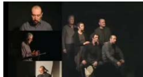
Scene tratte da "L'Inferno è vuoto" del Teatro di Eligio

Primo spettacolo il 16 novembre alle ore 20.45