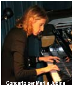
Concerto per Marija Judina